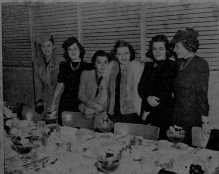
Judy Garland en compañía de damas latino-americanas.

Los más hermosos servicios prestados, las más duras tareas, están en general, poco a nada retribuidos. Felizmente, siempre habrá personas dispuestas para las funciones desinteresadas, y aún para las que sólo se pagan con sufrimientos, y que cuestan el dinero, el reposo y la vida.