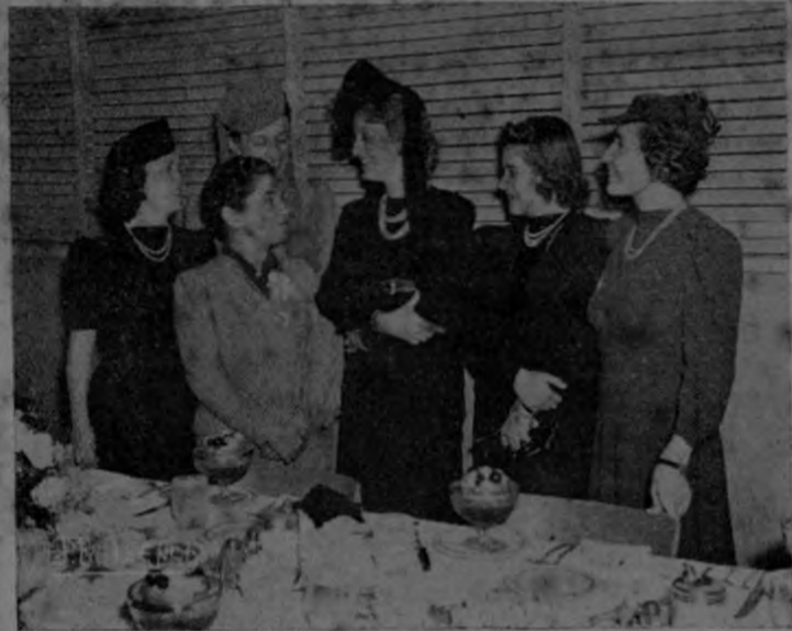
Jeanette Mac Donald, la Directora de MUJER Y HOGAR y compañeras de viaje alrededor de los EE. UU.

"No quise, nos decía una vez el inolvidable artista de la pluma, don Alberto Masferrer, aceptar la invitación para que conociese toda la trama milagrosa del cine, que habla al alma por medio del órgano visual, cuando ignoramos cuanto se pasa entre sus bastidores. No acepté destruir en mi mente la única ilusión que me restaba en la vida y decliné el honor de la invitación".